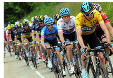
Critérium du Dauphiné 2013