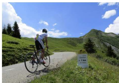
© Savoie Mont Blanc / Henderson - Col du Glandon