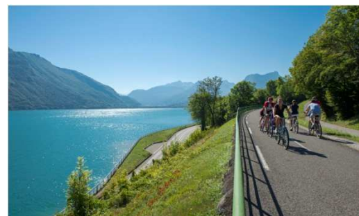
Voie verte entre Duingt et le Bout du Lac d'Annecy